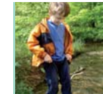
2 Wasser entdecken