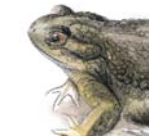
3 Kröten suchen