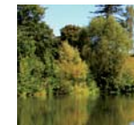
4 Natur im Gleichgewicht