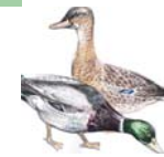
1 Stockenten beobachten