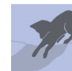
3 Wissenswertes erfahren