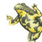
2 Wald erleben