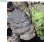
1 Natur entdecken

Der 2 km lange Rundweg besteht aus geschotterten Wald- und Fußwegen. Empfehlenswert ist festes Schuhwerk.