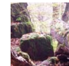
4 Wald begreifen