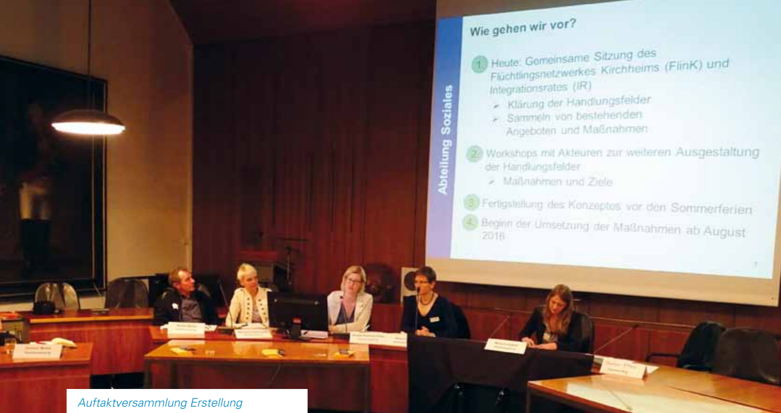
Auftaktversammlung Erstellung Integrationskonzept 22. Februar 2016