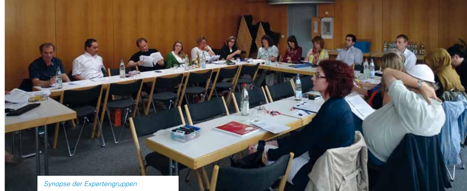
Synopse der Expertengruppen 9. Juni 2016

Geleitet wurden die Expertengruppen von Mitarbeiterinnen der Stadtverwaltung. Als Experten mitgearbeitet haben MitarbeiterInnen von Institutionen und Behörden, darunter von Wohlfahrtsverbänden, der Stadtverwaltung und Bildungseinrichtungen, ferner Mitglieder von politischen Gremien, Vereinen, städtischen Arbeitskreisen und Arbeitsgruppen, und schließlich Engagierte aus der Bürgerschaft.