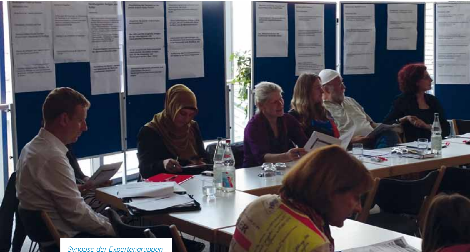
Synopse der Expertengruppen 9. Juni 2016

Einzelne Maßnahmen können auf ganz bestimmte, von Integrations-themen betroffene Zielgruppen zugeschnitten sein. Auch Einheimische können als aktive oder passive NutznießerInnen Zielgruppe von Integrationsmaßnahmen sein.