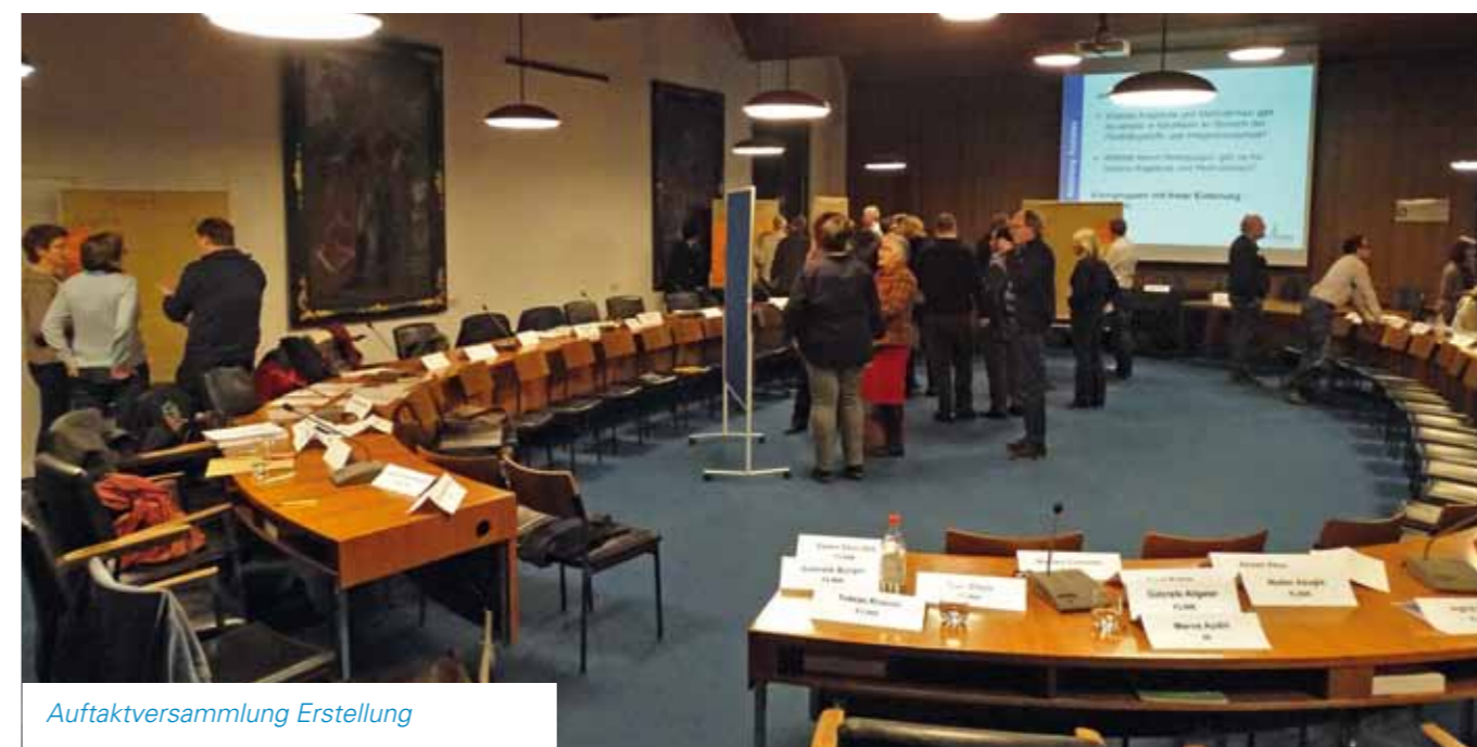
Auftaktversammlung Erstellung Integrationskonzept 22. Februar 2016

Im März 2016 wurde mit dem Integrationsrat das Verständnis von „Integration“ für Kirchheim unter Teck diskutiert (vgl. Kapitel 3.1).